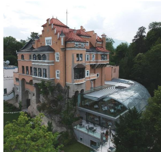
Visualisierung VS Realisierung des luxuriösen Hotels Mönchstein